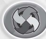
Tout le monde joue